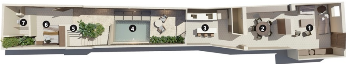
PB / Ground floor