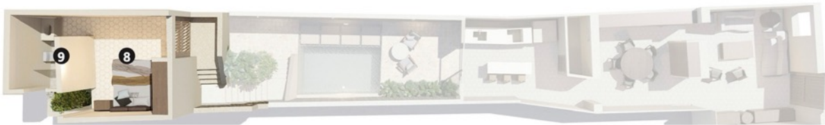
PA / Upper level