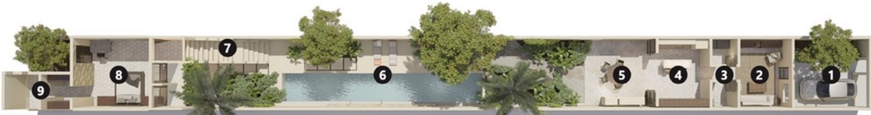
PB / Ground floor