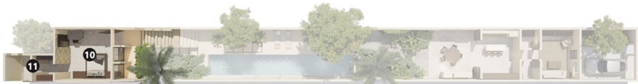
PA / Upper level