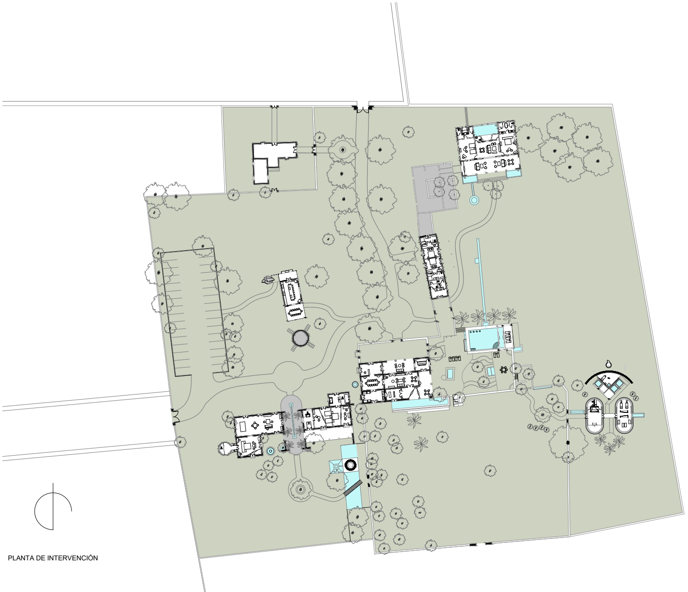
PLANTA DE INTERVENCIÓN